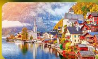
การันตีพัก Hallstatt / St. Wolfgang หรือริมทะเลสาบ 1 คืน