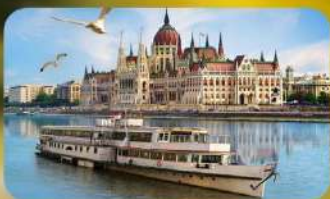
ล่องเรือแม่น้ำดานูบ พร้อมจิบแชมเปญ