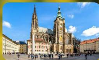
เข้าชม 2 ปราสาท ปราก และเซนต์บรุนนี