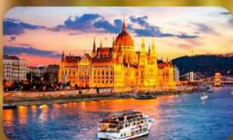
ล่องเรือแม่น้ำดานูบ ช่วง Twilight พร้อมจิบแชมเปญ