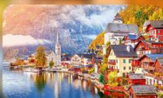
การ์นต์พิก Hallstatt / St. Wolfgang หรือริมทะเลสาบ 1 คืน