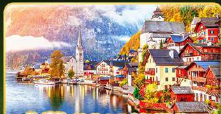
การ์ตูนดีเดินทาง Hallstatt / St. Wolfgang หรือริมทะเลสาบ 1 คืน