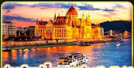
ล่องเรือแม่น้ำดานูบ ช่วง Twilight พร้อมจิบแชมเปญ

📅 เดินทาง: 02-09 ธ.ค. | 06-13 ธ.ค. 10-16 ธ.ค. 69