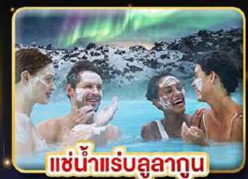
แช่น้ำแร่ลูลาทูน