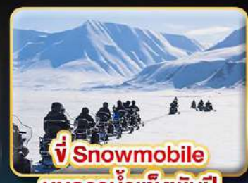
ขี่ Snowmobile บนธารน้ำแข็งพันปี