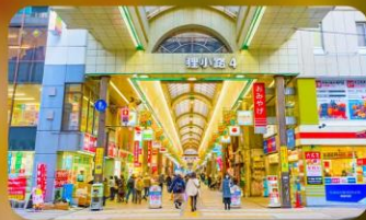
ซุปป์ิงถนนทากูกิโคจิ