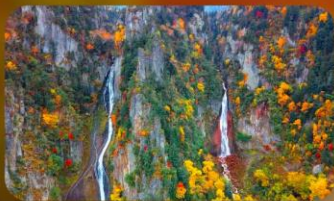
น้ำตกกิงกะ และน้ำตกริวเซ