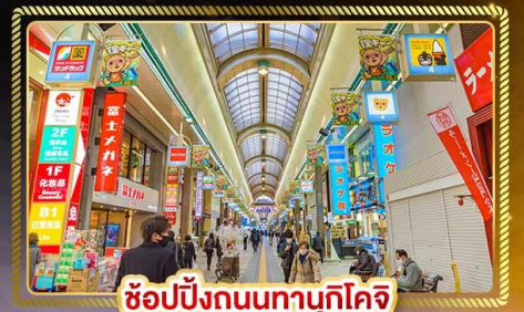
ช้อปปิ้งถนนทานุกิโคจิ