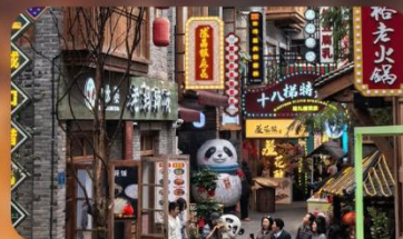
หมู่บ้านสี่पाती