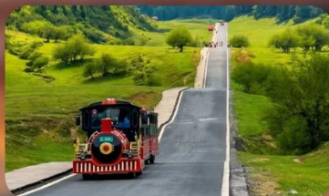
หุบเจานางฟ้า