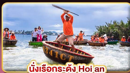
นั่งเรือระดั่ง Hoi an