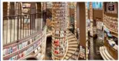
ร้านหนังสือจงซูเก่อ