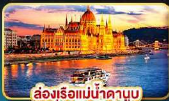
ล่องเรือแม่น้ำดานูบ ช่วง Twilight