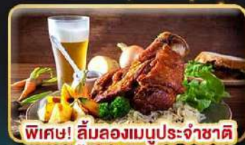
พิเศษ! ลิ้มลองเมนูประจำชาติ ถึง 5 ประเทศ!!!