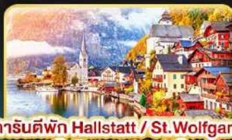
การันตีพัก Hallstatt / St. Wolfgang หรือริมทะเลสาบ 1 คืน