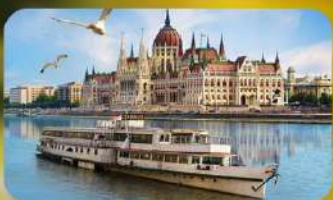
ล่องเรือแม่น้ำดานูบ พร้อมจิบแชมเปญ