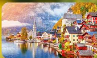
การันตีพัก Hallstatt / St. Wolfgang หรือริมทะเลสาบ 1 คืน