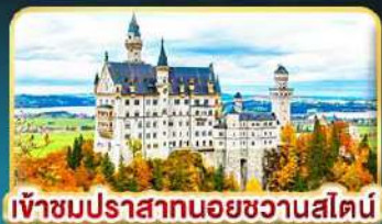
เข้าชมปราสาทนอยชวานสไตน์

คัดสรรความเป็น "ที่สุด" ของยุโรปตะวันออกครบถ้วน