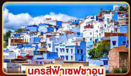
นครสีฟ้าเชฟชาอูน

📅 เดินทาง: 18-27 ต.ค. | 02-11 ธ.ค. 69 27 ธ.ค. 69 - 05 ม.ค. 70