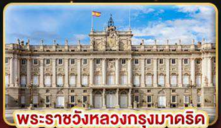
พระราชวังหลวงกรุงมาดริด