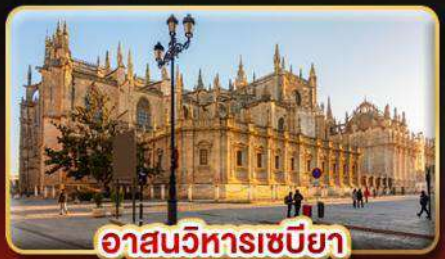
อาสนวิหารเซบิยา