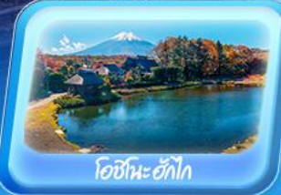
โอชิโนะอักษิ