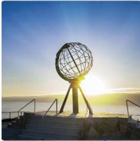
สัมผัสดินแดนไวคิง ชมพระอาทิตย์เที่ยงคืน