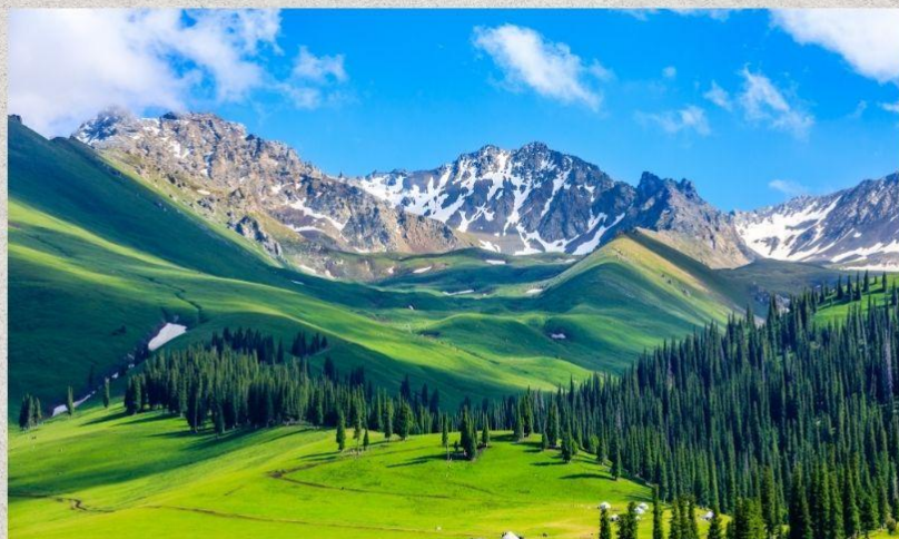
ทุ่งหญ้านาลาถึ