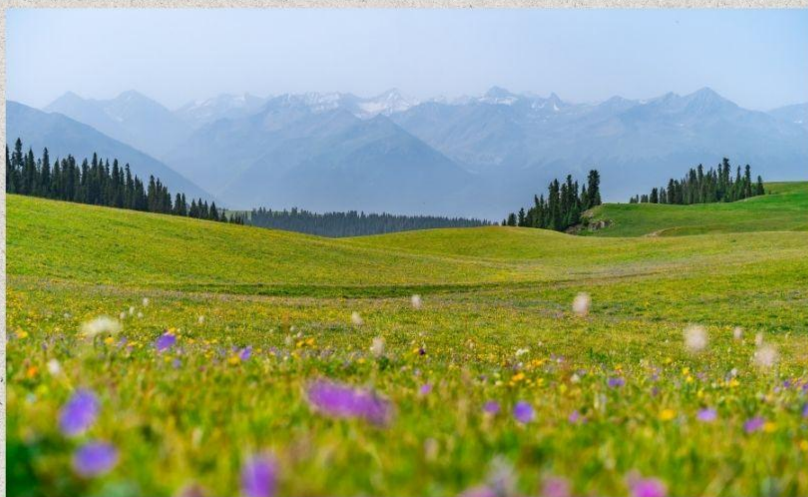
ทุ่งหญ้าคารา