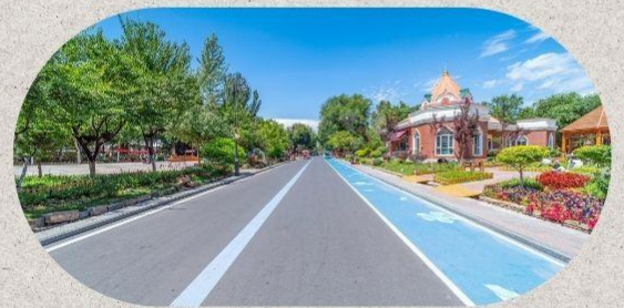
หมู่บ้านโบราณอุยกูร์คางันดี