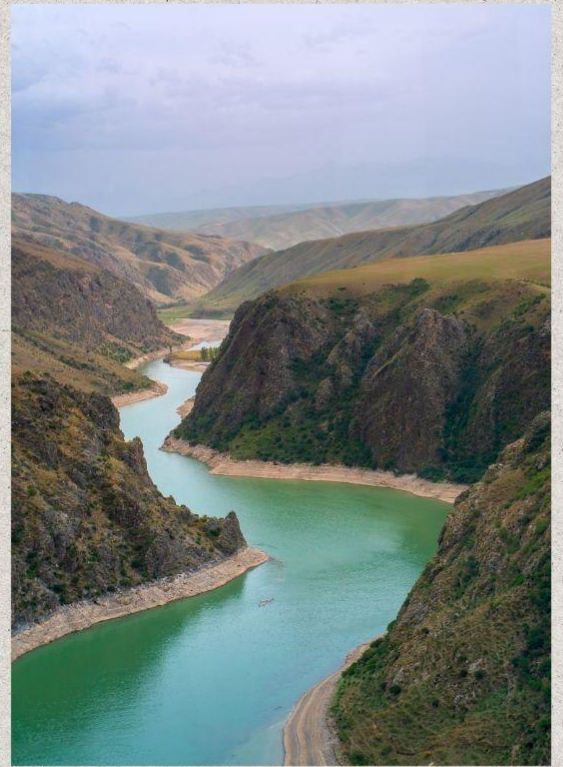
แกรนด์แคนยอนคุโคซู