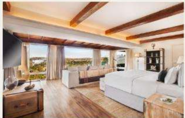
Gran Meliá Iguazú Argentina Side