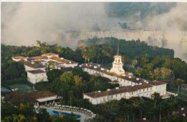
Hotel das Cataratas, A Belmond Hotel