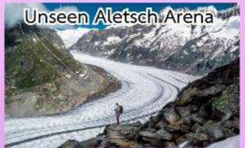
Unseen Aletsch Arena

ชมความงดงามของทะเลสาบเจนีวา ชมปราสาทชิลองที่เมืองมงค์เทออร์ช ล่องเรือชมความงามของทะเลสาบลูเซิร์น, พักในหมู่บ้านเซอร์แมท (เมืองตากอากาศปลอดมลพิษ ที่ได้ชื่อว่าสวยงามเหมือนสวรรค์บนดิน)