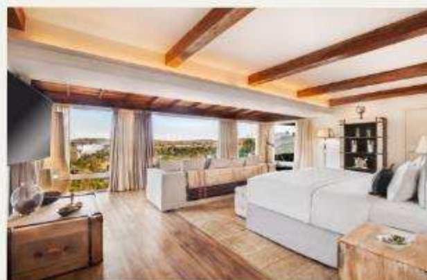
Hotel das Cataratas, A Belmond Hotel