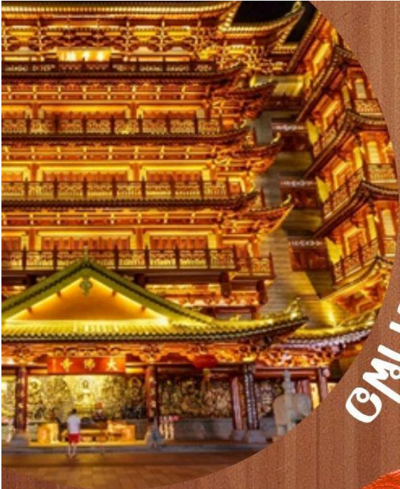
วัดเขาส่ง