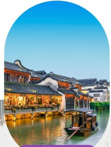
เมืองโบราณอู่เงิน