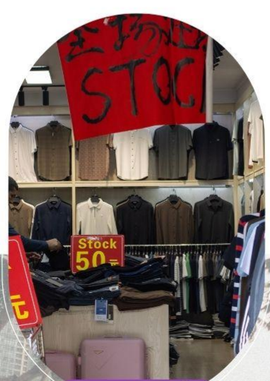
ตลาดค้าส่งอู่