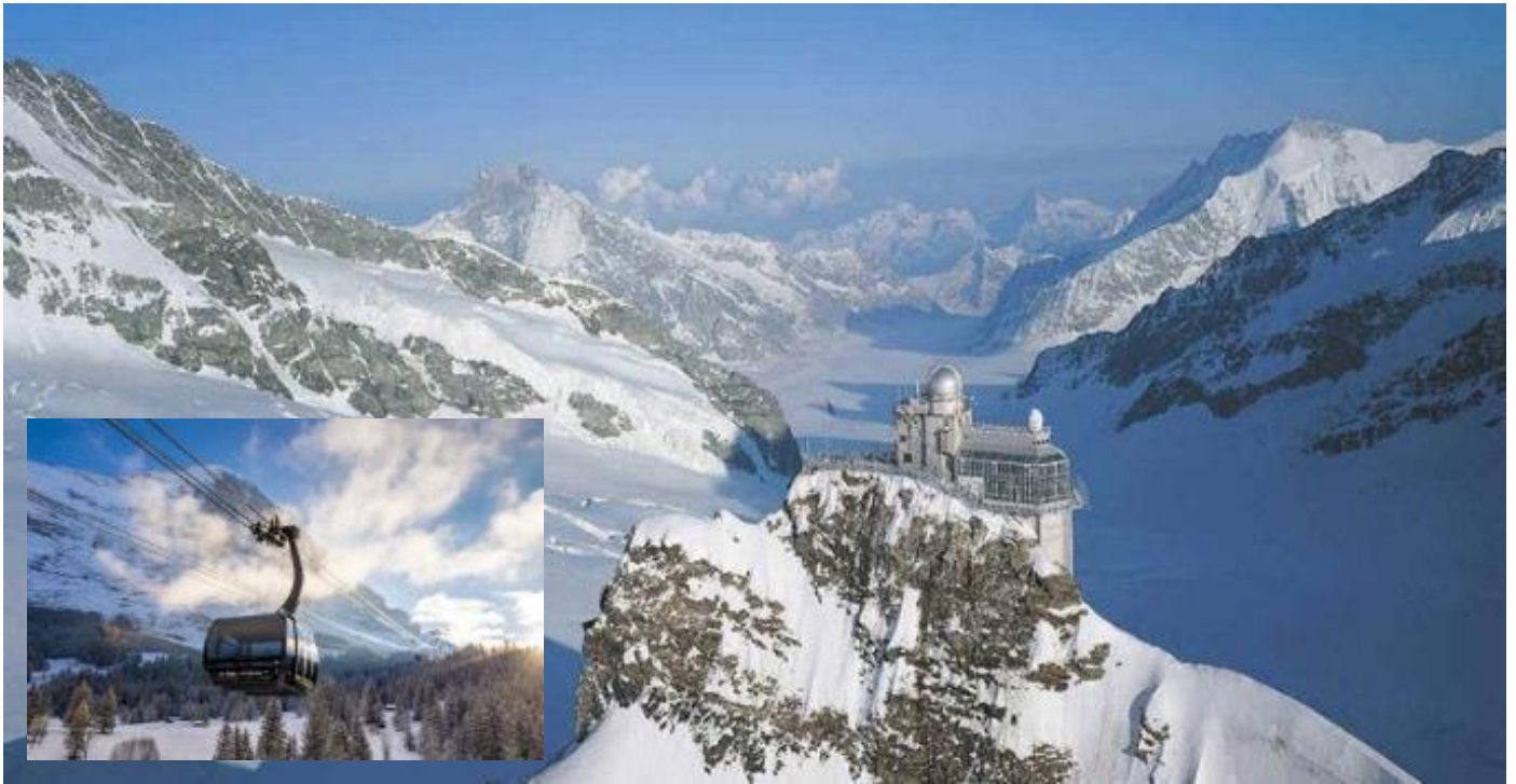
บ่าย นำท่านเดินทางลงเขาด้วยรถไฟ ฟันเฟืองสู่สถานีไอเกอร์ (Eigergletscher) จากนั้นโดยสารกระเช้าชมวิว เทือกเขาแอลป์ (The Eiger Glescher) ลงสู่สถานีเทอร์มินัล กรินเดลวาลด์ ซึ่งใช้เวลาเพียง 12 นาทีเท่านั้น