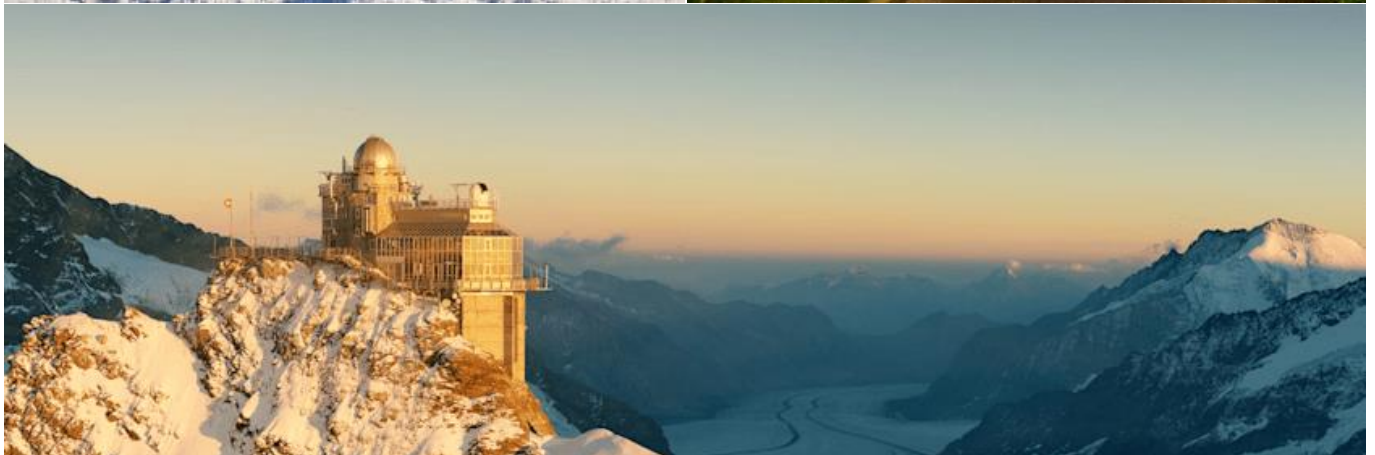
นำท่านเก็บบรรยากาศความสวยงามของหมู่บ้านกรินเดลวาลด์(GRINDELWALD) หมู่บ้านเล็กๆ ใจกลางหุบเขา บน เทือกเขาแอลป์(BURNESE ALPS) ตั้งอยู่ในระดับความสูงจากระดับน้ำทะเล 1,034 เมตร แม้จะเป็นหมู่บ้าน