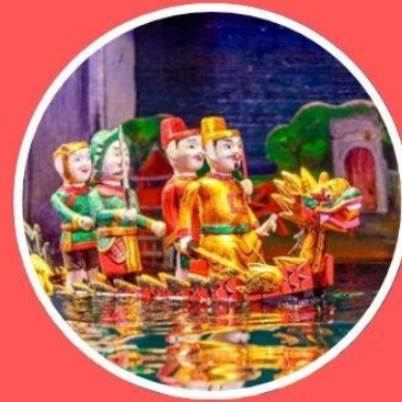
โชว์หุ่นกระบอกน้ำ ก้างลอง