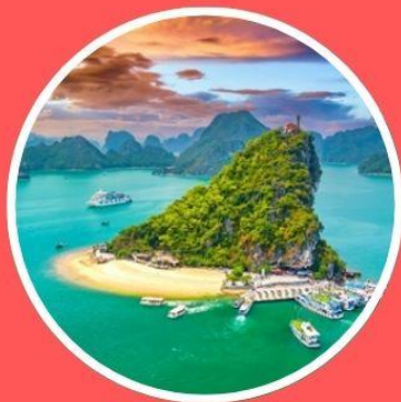
อ่าวฮาลองเบย์