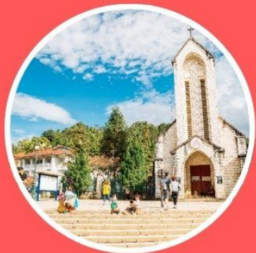
โบสถ์หิินซาปา