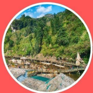
หมู่บ้านชาวเขากี้ตักี้ต