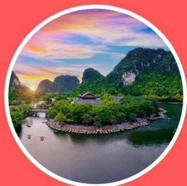
ล่องเรือจ่างอาน