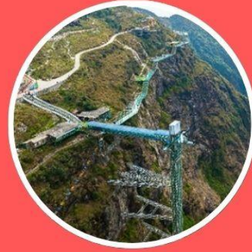
สะพานแกว้มังกรเมฆ