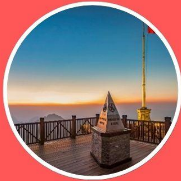
พานซีปิน