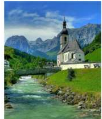
ออสเตรียบาวาเรียดินแดนแห่งเทพนิยาย

ออสเตรีย – บาวาเรีย (Austria-Bavaria) ดินแดนวัฒนธรรมเก่าแก่ที่ครอบคลุมสองประเทศและแทบแยกกันไม่ออกเลยว่าเราเที่ยวอยู่ในออสเตรียหรือเยอรมัน ท่านจะประทับใจไปกับหมู่บ้านเล็กๆน่ารัก ที่ตั้งอยู่บริเวณริมทะเลสาบในเทือกเขา “เยอรมัน-ออสเตรียแอลป์” พร้อมบริการอาหารรสเลิศและที่พักอย่างดีระดับ 4 ดาว หรูหราที่เราคัดสรรมาให้ท่านได้พักผ่อนอย่างเต็มที่ให้การเดินทางของท่านคุ้มค่าที่สุดในเส้นทางที่สวยงามที่สุดของออสเตรีย-บาวาเรีย