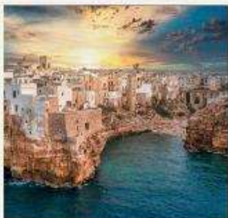
POLIGNANO A MARE

อิตาลีตอนใต้มีเสน่ห์ดึงดูดใจอย่างยิ่ง เป็นดินแดนโรมันติกแห่งปราสาท โบสถ์ และซากปรักหักพังแบบคลาสสิก ไม่ว่าจะเป็นวิลล่าโพลิญาโน อามาเร่ ร้านอาหารสุดหรูในถ้ำ GROTTA PALAZZESE พระราชวังในโพซิทาโน อ่าวเนเปิลส์มีเสน่ห์ดึงดูดใจอย่างเหลือเชื่อ ตั้งแต่เกาะคาปรีที่สวยงามตระการตาไปจนถึงภูเขาไฟที่สงบนิ่ง และแหล่งโบราณคดีระดับโลกไปจนถึงชายฝั่งอามาลฟีที่คดเคี้ยว แคว้น "ปูลยา" เป็นที่รู้จักกันดี ด้วยสถาปัตยกรรมแบบโรมานเนสก์และบาโรก ปราสาทของนักรบครูเสด และบ้านทรงกรวยคล้ายรังผึ้งที่เรียกว่าทรูลลี เป็นจุดหมายปลายทางที่กำลังมาแรง