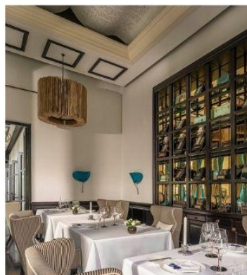
ร้าน La Maison 1888