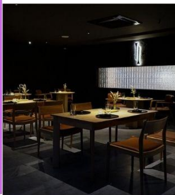
ร้าน Nen Restaurant