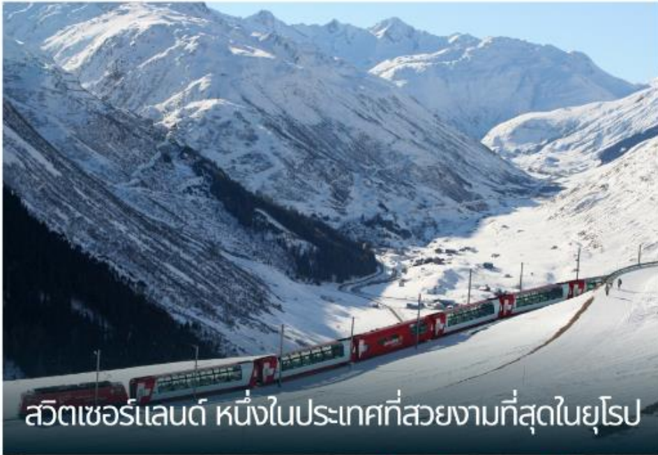
สวิตเซอร์แลนด์ หนึ่งในประเทศที่สวยงามที่สุดในยุโรป

เที่ยวชมสถานที่ท่องเที่ยวยังคง บรรยากาศดั้งเดิมของสวิตเซอร์แลนด์ อันสวยงาม (Unseen Switzerland) นั่งรถไฟและรถรางชมวิว ขบวนที่มีชื่อเสียง ของสวิตเซอร์แลนด์ ถึงห้าขบวน