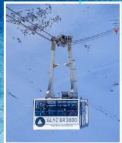
GLACIER3000 Peak walk by Tissot