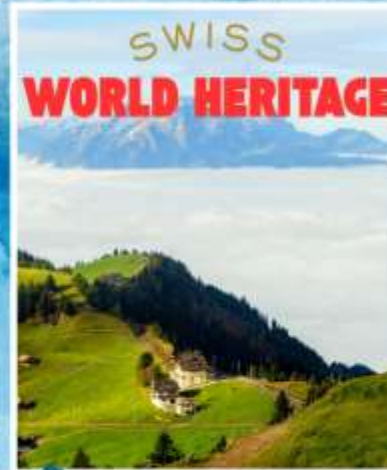
RIGI KULM Queen of the Mountains