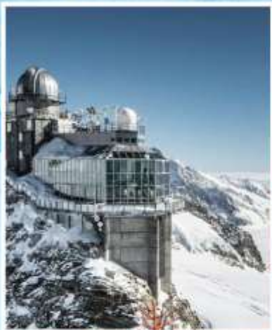
JUNGFRAUJoch "Top of Europe"