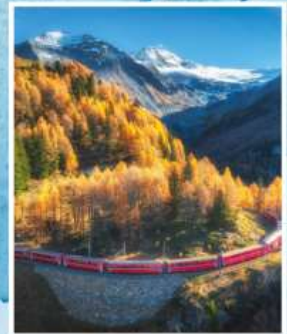
BERNINA EXPRESS Unesco World Heritage

ราคาพิเศษเริ่มต้นเพียง 119,900.- (รวมค่าวีซ่า)