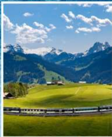
GOLDEN PASS LINE Montreux-Zweisimmen