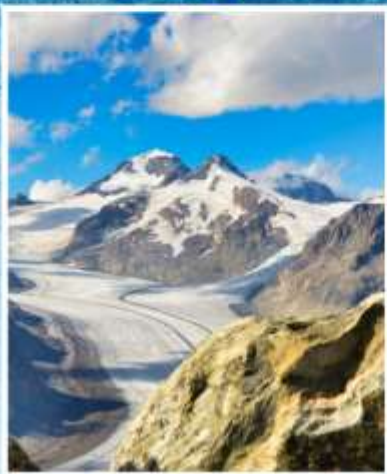
ALETCH GLACIER Riederalp, Bettmeralp

แกรนด์สวิตเซอร์แลนด์ 9 วัน QR พักหมู่บ้านเชอร์แมท(พ.ย./มี.ค.)